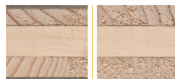
TYPE PS / 27 | TYPE PL / 27 Épaisseur: 27 mm

Structure interne: contreplaqué bouleau / trois couches de sapin